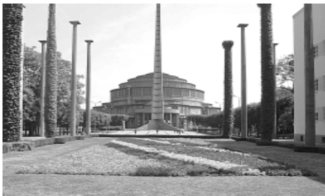
Конгресната зала. Общ изглед на конгресната зала и околностите.